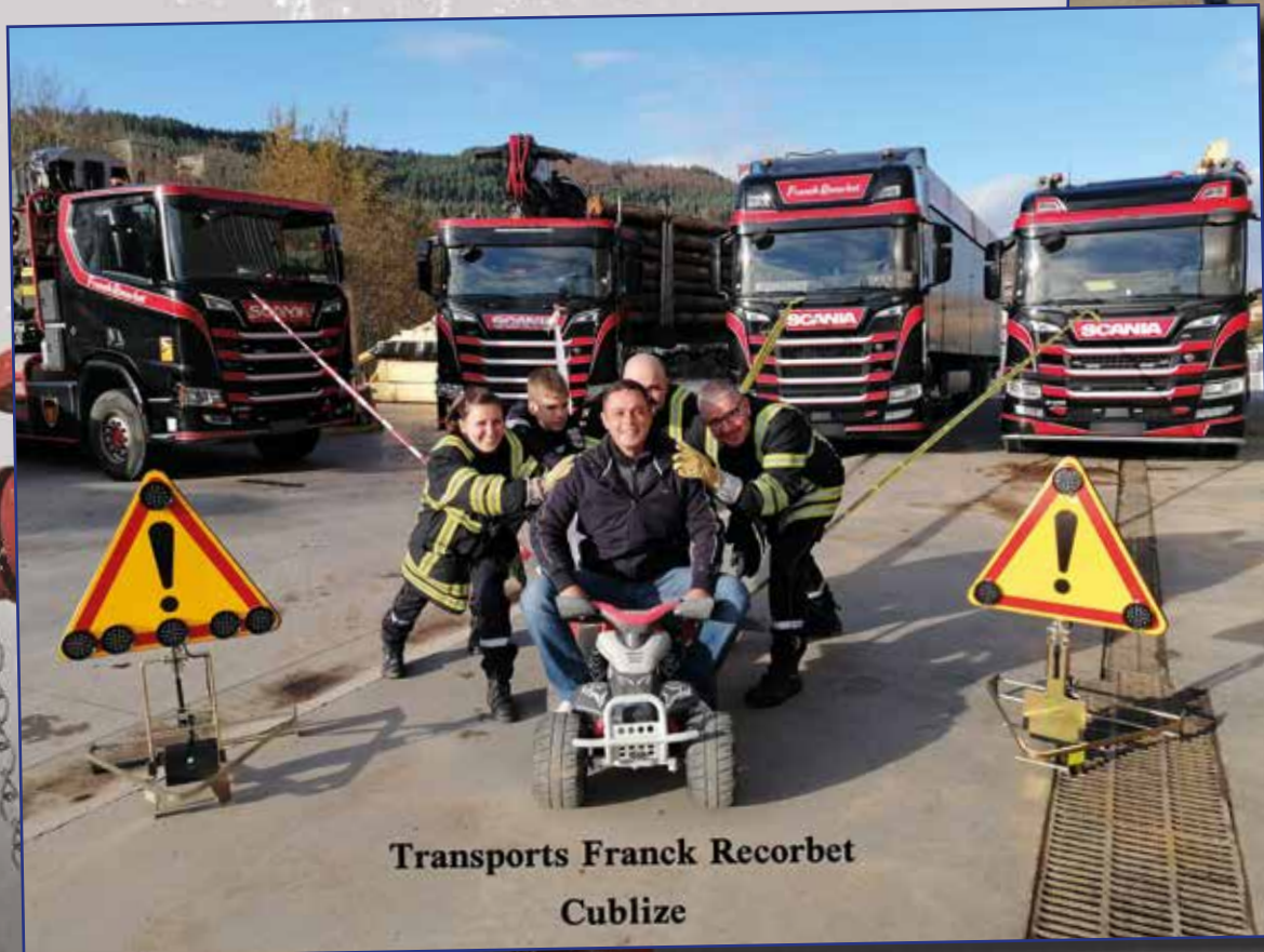
Transports Franck Recorbet Cublize