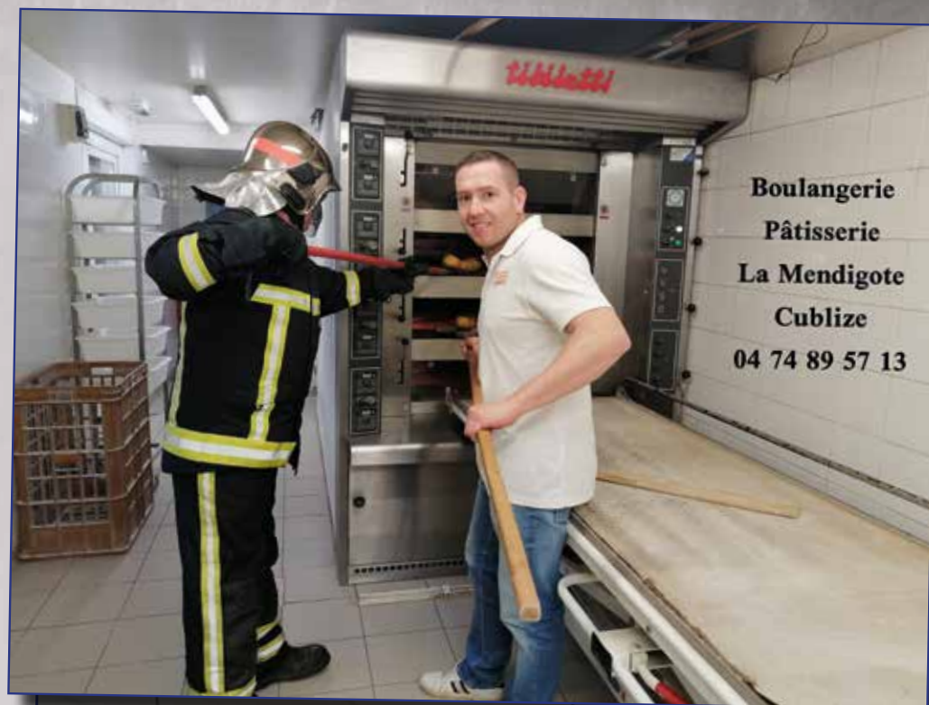
Boulangerie Pâtisserie La Mendigote Cublize 04 74 89 57 13