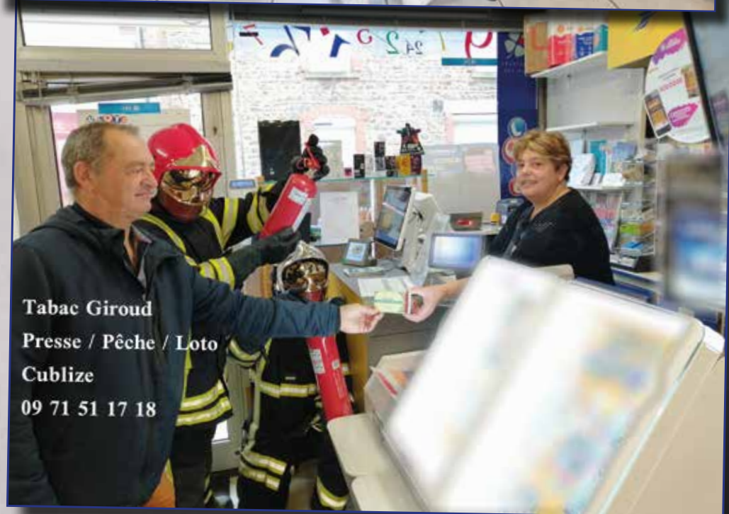
Tabac Giroud Presse / Pêche / Loto Cublize 09 71 51 17 18