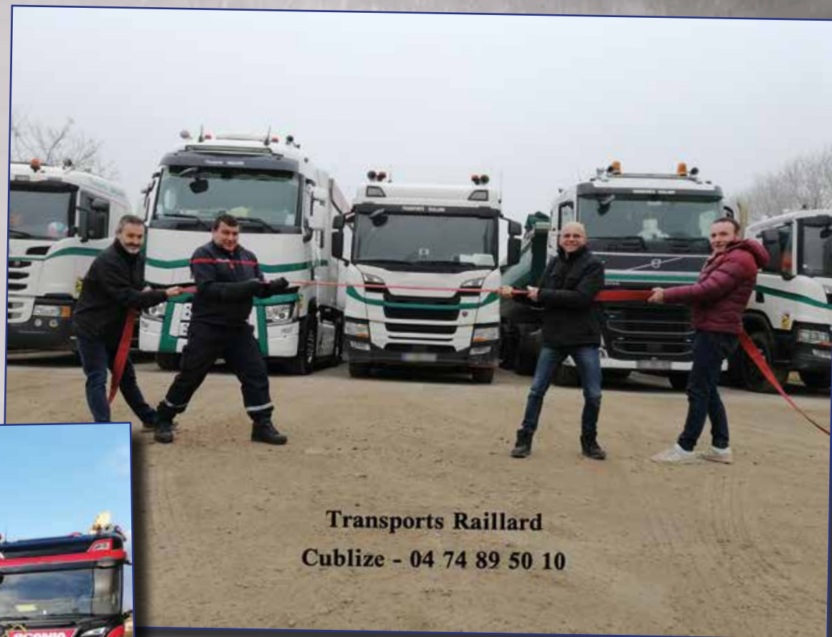
Transports Raillard Cublize - 04 74 89 50 10