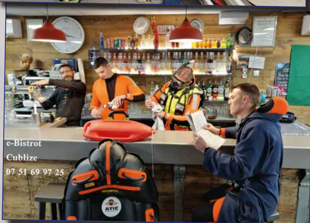
e-Bistrot Cublize 07 51 69 97 25