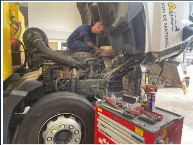
Sapeur Bertrand, 13 années d'engagement volontaire, Mécanicien Poids Lourds