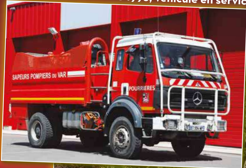
CCFS Mercedes-Benz de 1998, véhicule en service