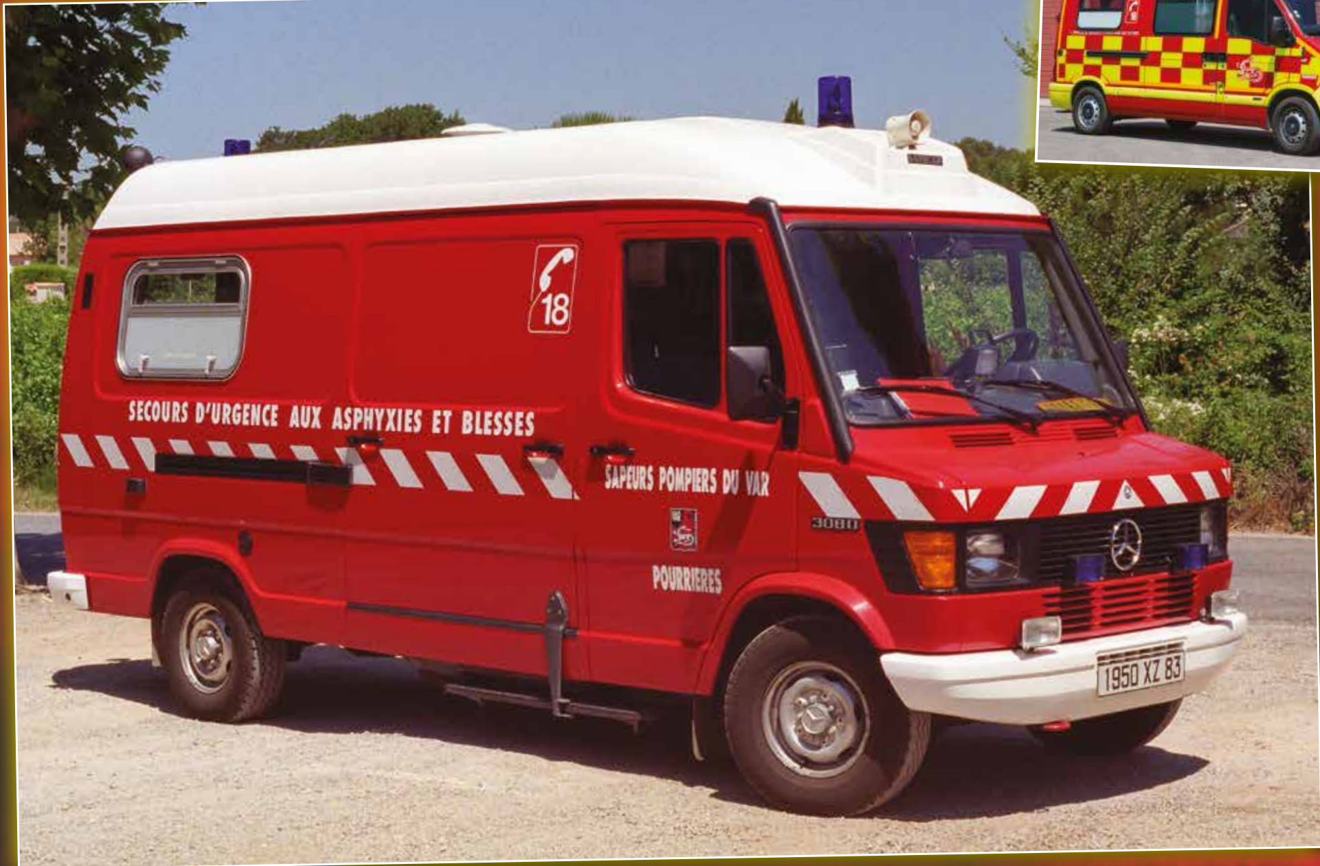
VSAB 0145 Mercedes-Benz de 1995, véhicule réformé