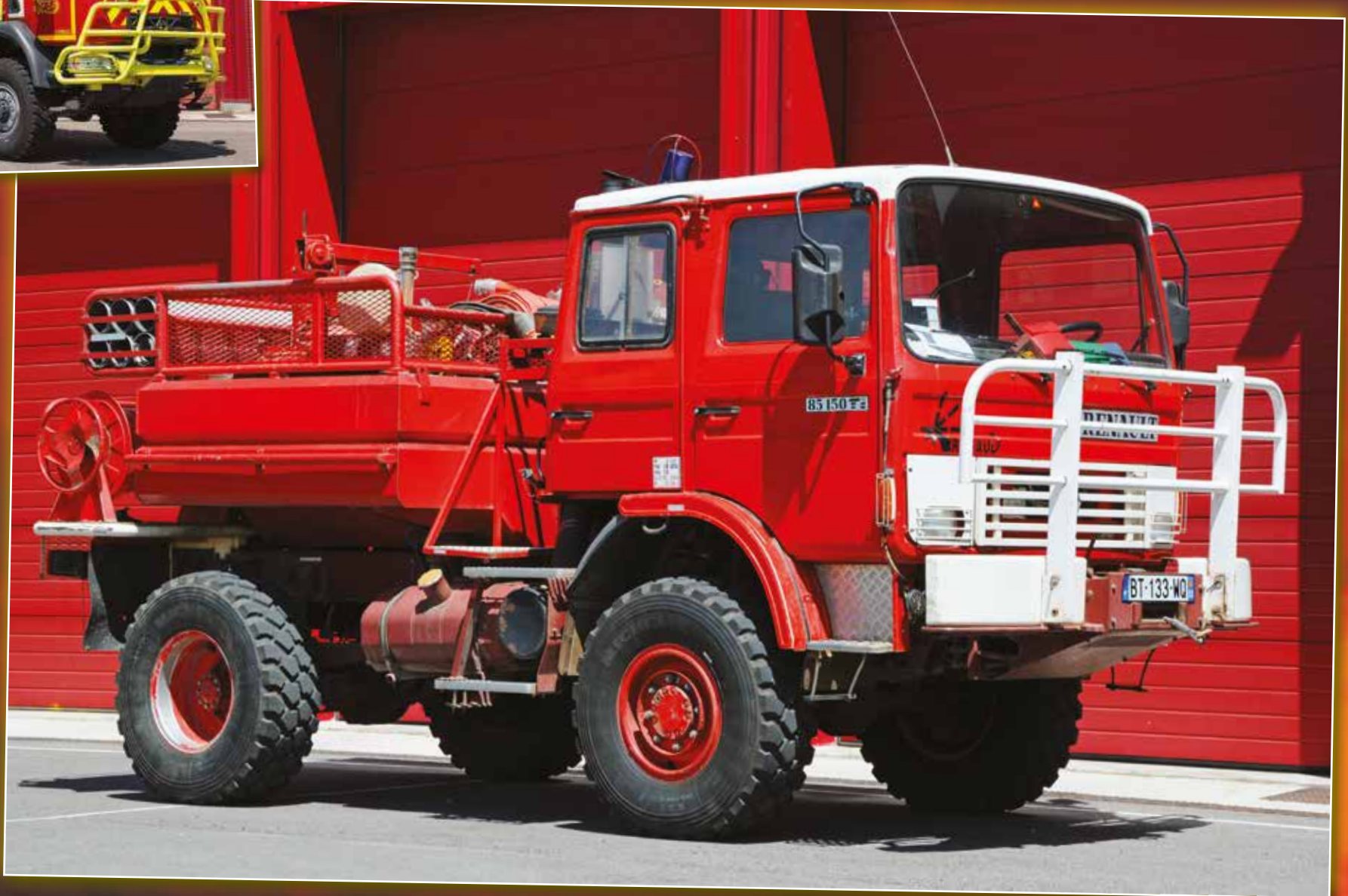
CCFM 0167 Renault 85.150 de 1990, véhicule réformé