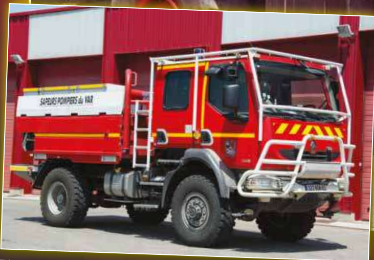
CCFM 0180 Renault Midlum de 2008, véhicule réattribué