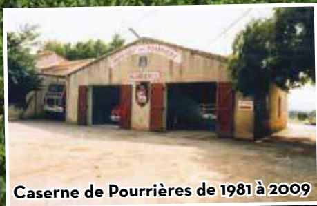
Caserne de Pourrières de 1981 à 2009