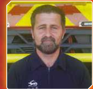
Lysian 1ère Classe