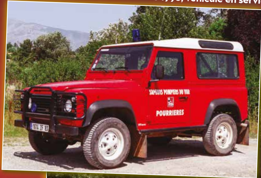
VTT 0147 Land Rover Defender de 1998, véhicule en service