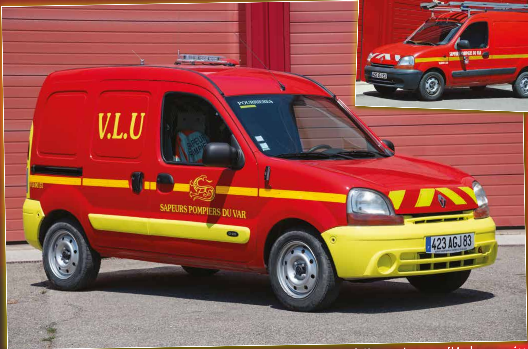
VLU 0151 Renault Kangoo de 2001, véhicule en service