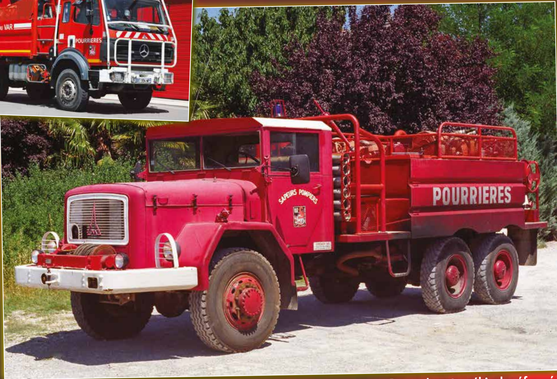
CCF 0086 Magirus-Deutz de 1962, véhicule réformé