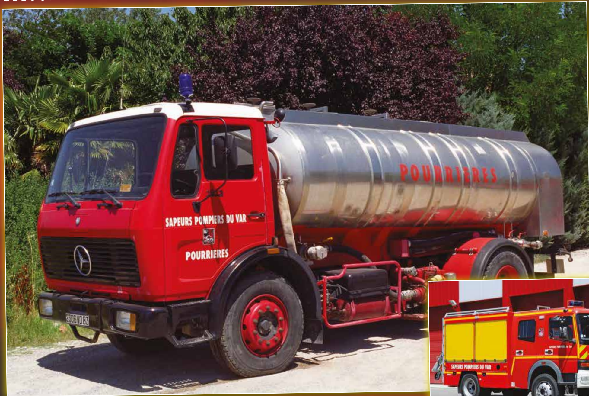
CCGC 0021 Mercedes-Benz de 1985, véhicule réformé