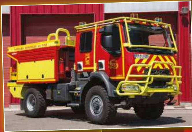
CCFM 0315 Renault D14 de 2019, véhicule en service