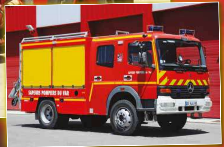
VIP 0011 Mercedes-Benz de 2002, véhicule en service