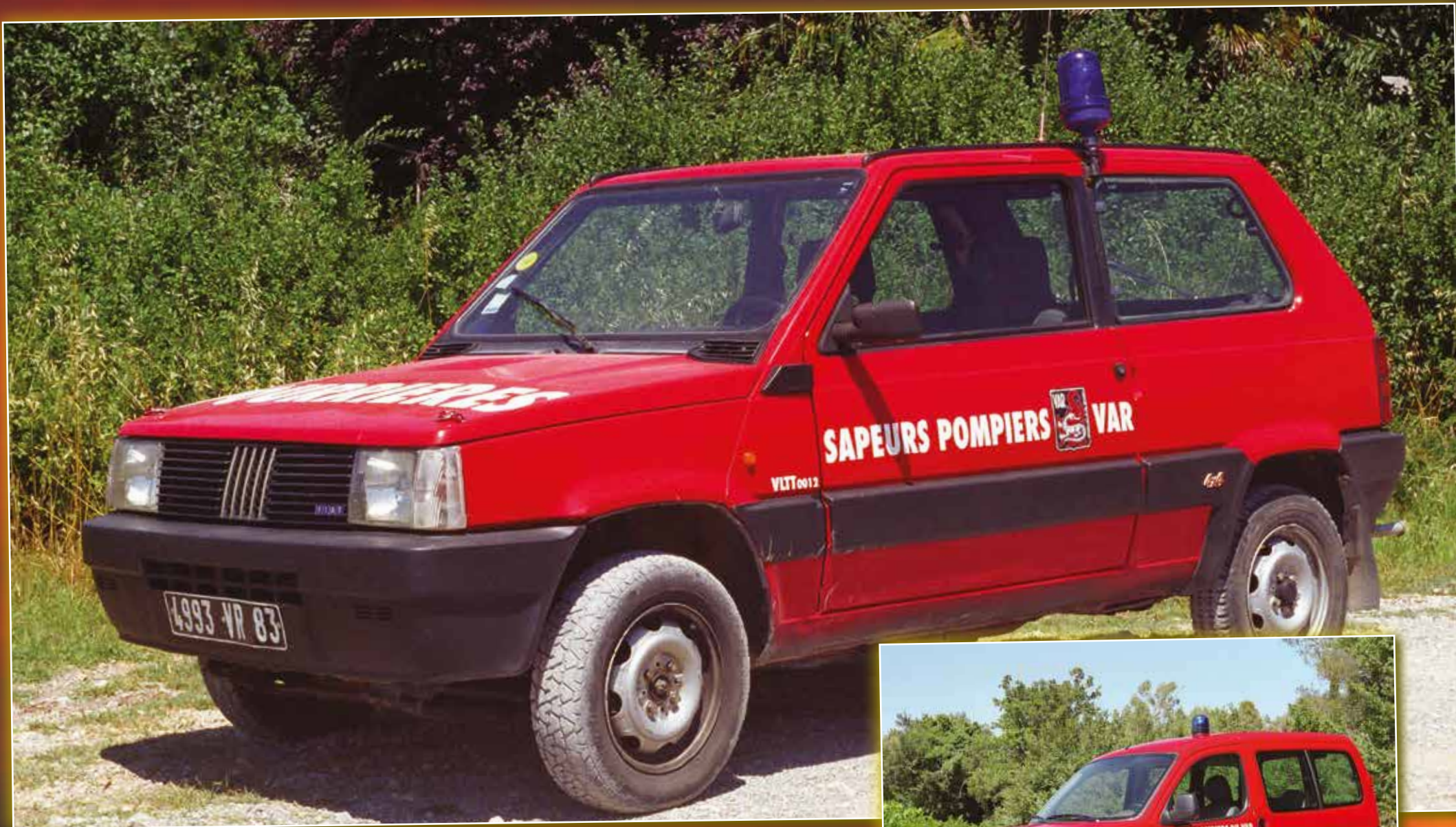
VLTT 012 Fiat Panda de 1989, véhicule réformé