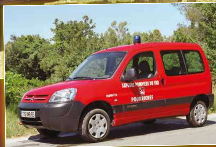
VL 0335 Citroën Berlingo de 2003, véhicule en service