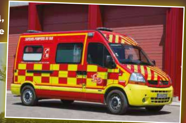
VSAV 0009 Renault Master de 2004, véhicule reconditionné en service