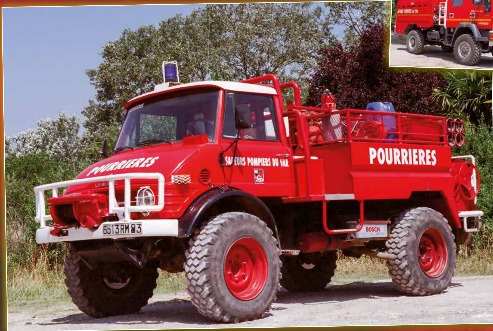
CCFM 0218 Man de 2004 véhicule Réattribué