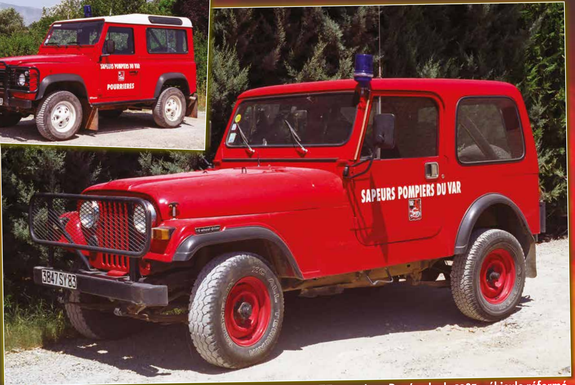
VTT 0015 Jeep Renegade de 1983, véhicule réformé