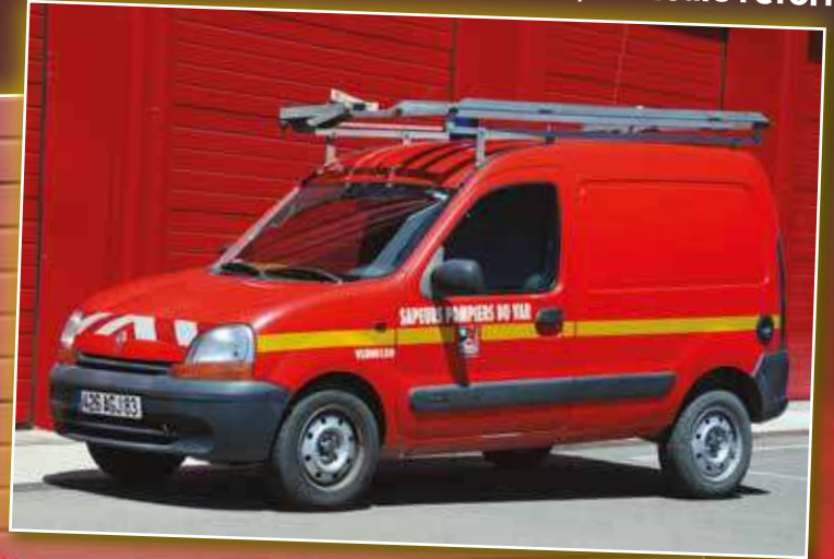
VLU 0150 Renault Kangoo de 2001, véhicule réformé