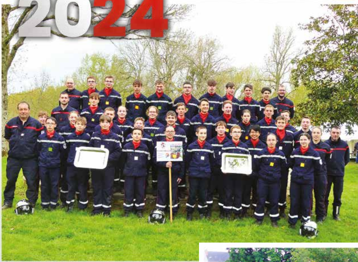
Section des jeunes sapeurs-pompiers