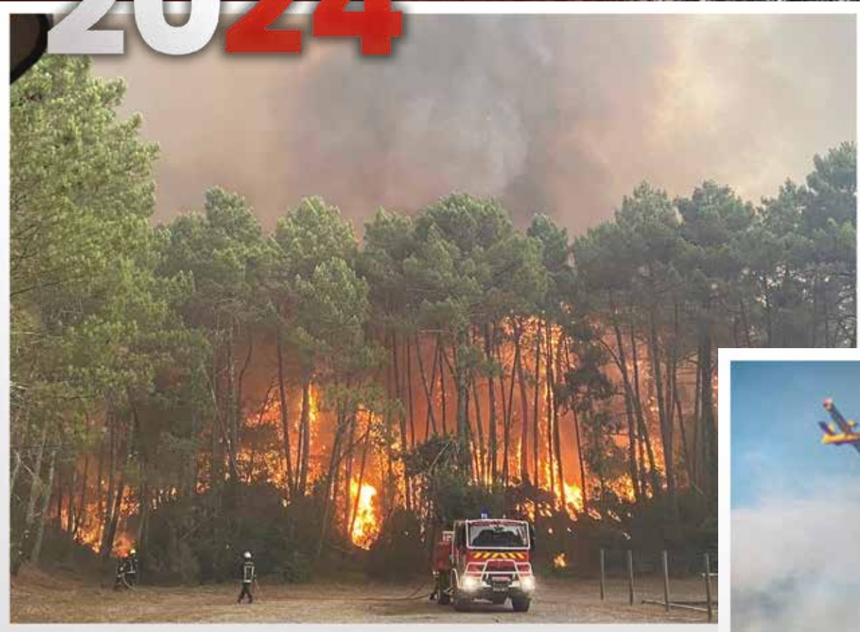
Renforts extra-départementaux - été 2022 (Gironde)