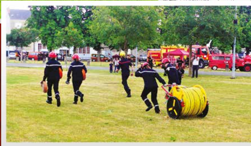
Manœuvres jeunes sapeurs-pompiers