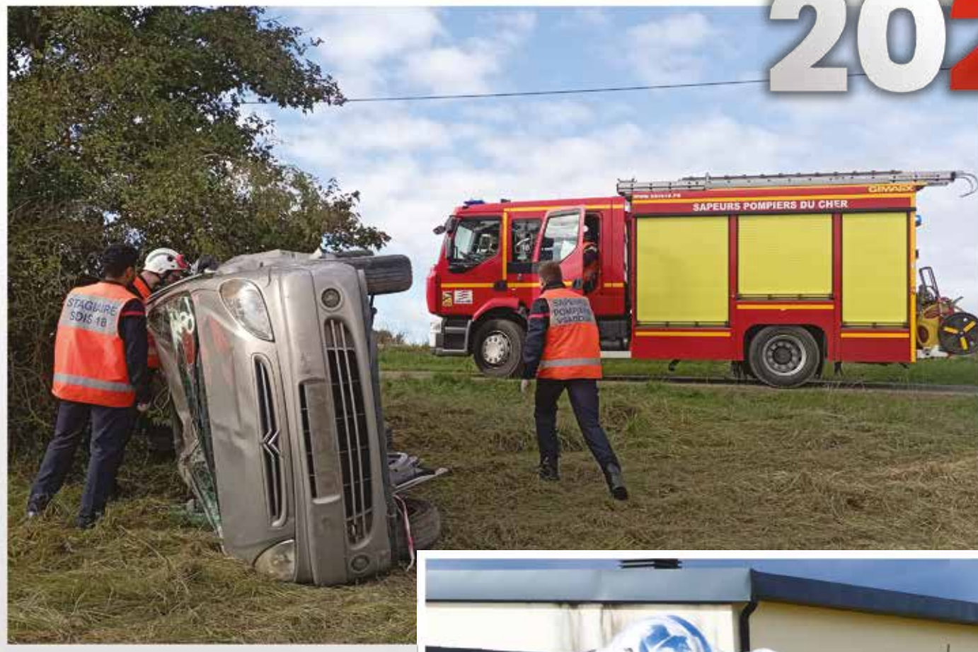
Manœuvres secours routier