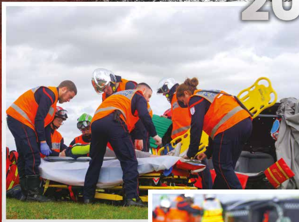
Manœuvres secours routier Portes ouvertes du 18 mars 2023