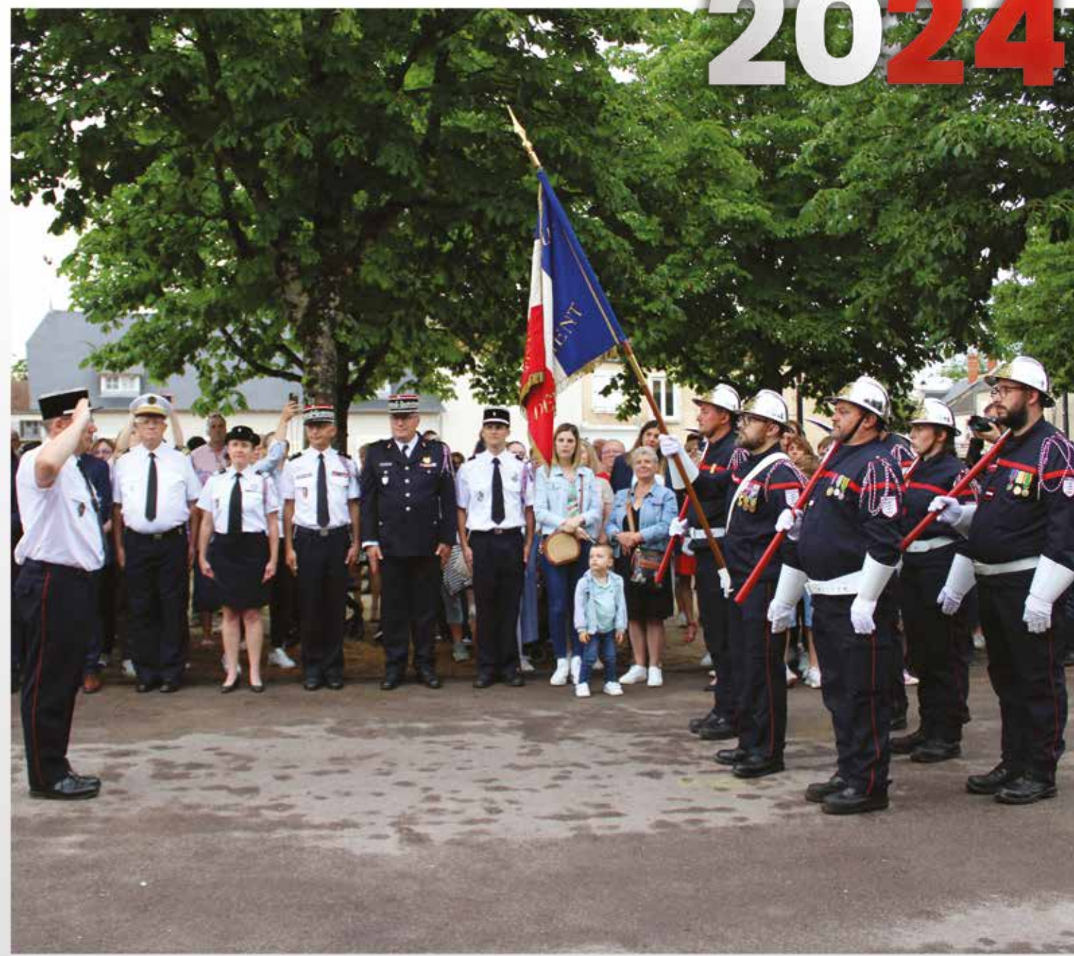
Garde au drapeau - Congrès départemental des Sapeurs-Pompiers du Cher (Dun-sur-Auron)