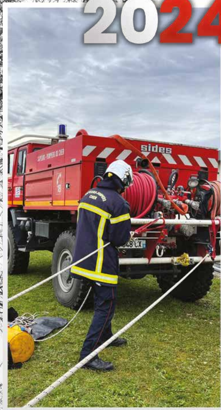
Manœuvre lot de sauvetages et de protection contre les chutes