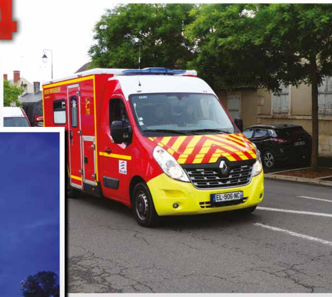
Véhicule de secours et d'assistance au victime