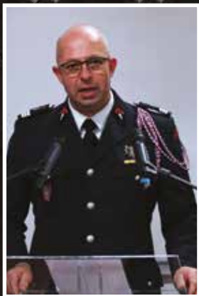
Mot du Chef de Centre