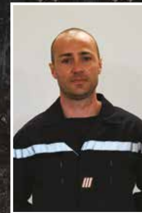
Mot du Président de l'Amicale