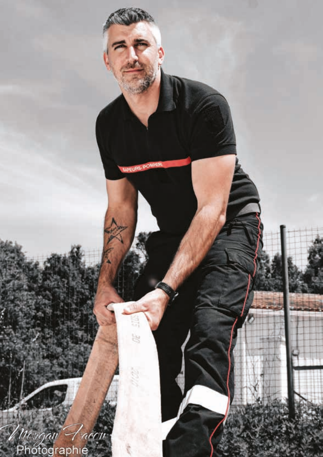
Morgan Facon Photographie