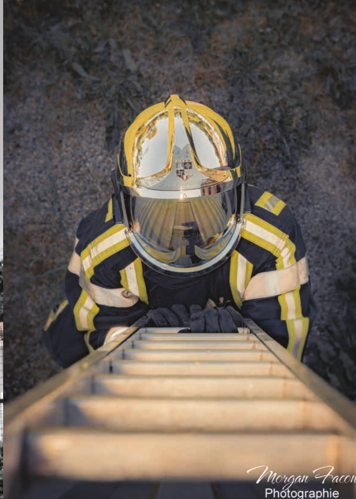
Morgan Facon Photographie