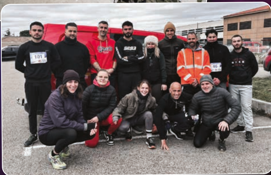
Cross départemental 2024 - Lédignan