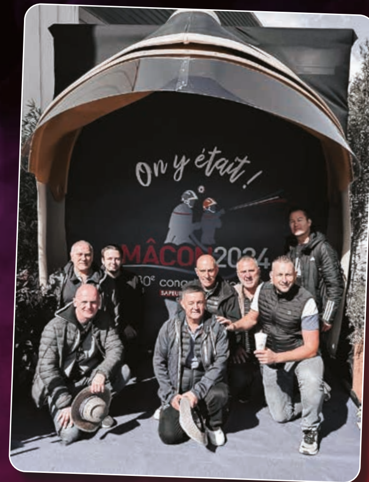
Congrès national des Sapeurs-Pompiers 2024 Mâcon