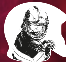
Sapeur 2ème Classe MESTRIE Emy