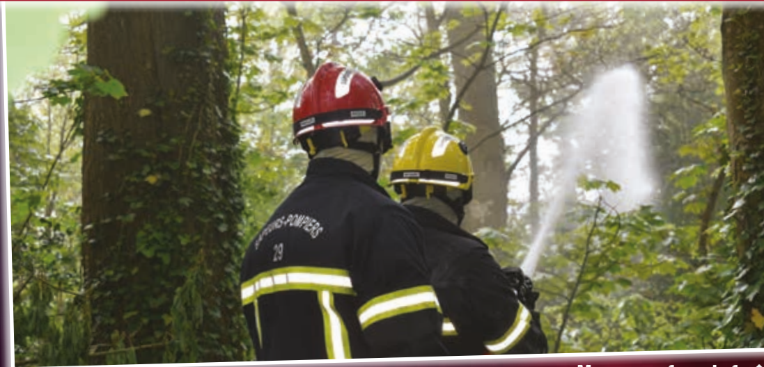
Manœuvre feux de forêts